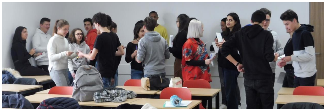
Cultivons l'envie d'agir !

Premier temps de formation + aide à la gestion de projet des avec l'association egraine , lundi 18 novembre 2019. 3 autres temps suivront les 9/12, 16/1 et 4/2/2020.