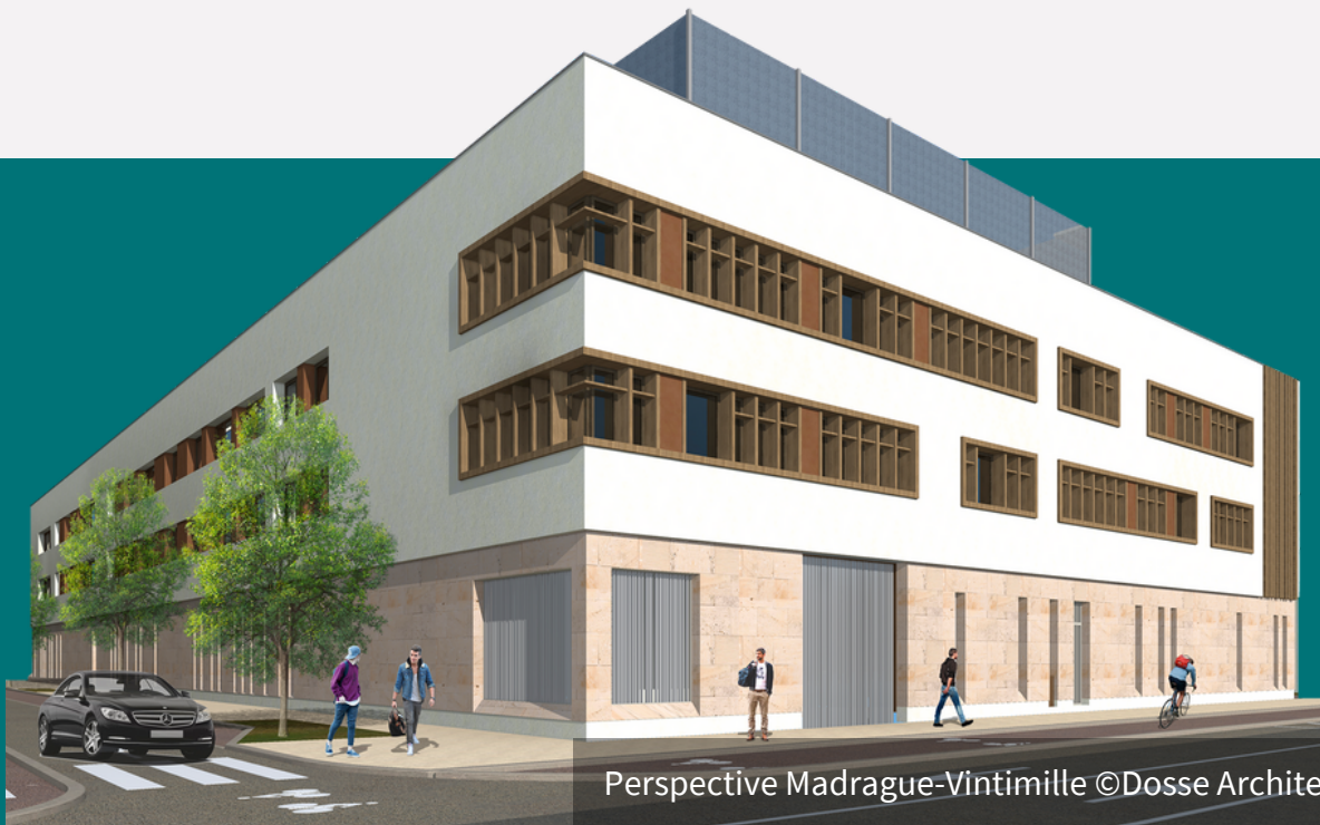
Perspective Madrague-Vintimille ©Dosse Architectes Associés

Vivre du bon esprit: comme dans les autres collèges de l'enseignement catholique des temps de formation humaine, spirituelle et pastorale seront prévus. L'objectif est de faire grandir le jeune et de créer l'environnement capable de former des femmes et des hommes au cœur large et généreux , ouverts au service.